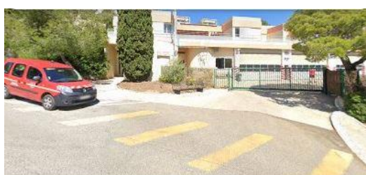
CIS CASSIS Pompiers 13

dans les minutes qui suivent pour vous installer dans votre appartement de vacances